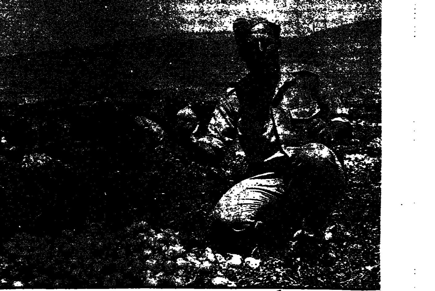
تعداد زيات لزراعة قوتية كمكسنة

خبرة الاجيال التي ورثتها عن ابائي واجدادي هي كز لا يثمن. الا انها لا تكفي وحدها.